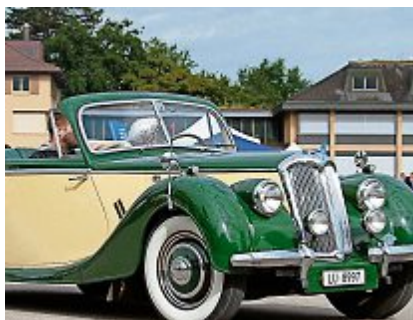
Event im Event Thema: Basel - Holzhäusern - Mailand 50 & 60er Jahre, Europa wird mobil z.V.g.

Am 2. Juli 2017, 9:30 Uhr, geht es in den Stierenstallungen in Zug bereits in die dritte Runde mit dem Oldtimer Sunday Morning Treffen. Es werden rund 700 Oldtimer, Autos, Motorräder und Nutzfahrzeuge aller Marken erwartet.