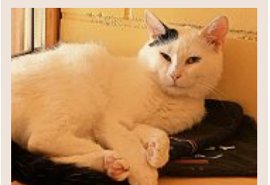
...und ihr Bruder Sunshine. z.V.g.

Nebst diesem miauenden Geschwisterpaar sind weitere Tiere des Tierheims Allenwinden und der Hundestation Neuheim auf der Suche nach einem neuen Zuhause. Weitere Informationen zu den Tieren finden Sie im Internet auf der Seite des Tierschutzvereins Zug unter der Adresse www.tsvzug.ch .