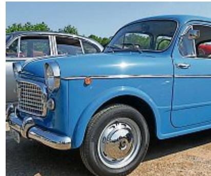
Legendäre Fiats zu Besuch in Zug. Oben links: ein Fiat 1500, daneben ein 124 Spider, unten links: Der Fiat 500 neben einem Fiat 1100.

«Oldhouse Jazzband» aus dem Säuliamt, die nebst den heissen «Cars» für heisse Rhythmen sorgt und die Stimmung vor Ort am Laufen hält. Doch damit nicht genug, nebst den geschwungenen Kurven der edlen alten Oldtimer, sorgen die Kurven der Charly Werder Models, mit einem speziellen Fotoshooting, mit Sicherheit für den einen oder anderen heissen Blick. Ein letztes Mal in diesem Jahr sorgt man auch in der bereits legendären «Aletsch Arena Oldtimer Bar» – beim einen oder anderen Benzingsgespräch – für die entsprechende Netzwerkpflege. Und ... einmal mehr freuen sich die «Pizza-Angels» auf ihre Gäste in der einladenden Festwirtschaft, um sie mit feinen Würsten vom Grill oder Piz-